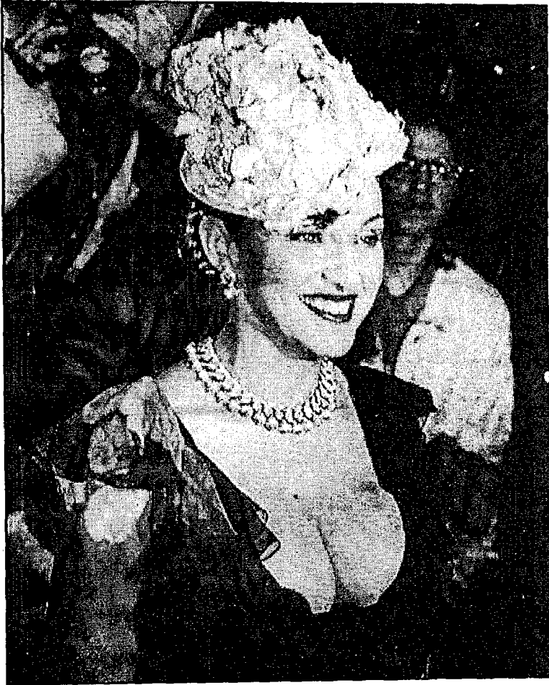
مادونا . مطربة الإنارة وإحدى وسائل اختراق شبابنا تحت شعار الفن والموسيقى